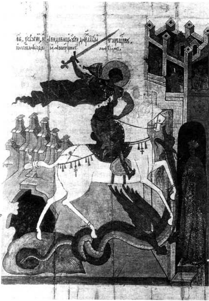
Великомученик Георгий Победоносец. Икона XVI в.

Кому-то может показаться удивительным, что на страницах философского трактата Иван Ильин прибегает к аргументам такого рода, как иконописные изображения святого Архангела Михаила и святого Георгия Победоносца. Внутренняя оправданность этой аргументации открывается только человеку, причастному жизни Церкви, способному воспринимать икону не только умом, но и сердцем, и видеть в ней не столько "произведение древнерусской живописи", но форму церковного сознания. "Явление ... громового облика в нашей иконописи — святой Георгий Победоносец. И ослепительное блистание его вихрем несущегося белого коня, и огневой пурпур его развивающейся мантии, и рассекающее воздух копье, которым он поражает дракона, — все это указывает на него как на яркий, одухотворенный образ Божьей грозы и сверкающей с неба молнии... Кроме того ... здесь над грозой и вихрем иконописец видит благословляющую с неба десницу, которой подчиняются и всадник, и конь". 89 Тот, кому дано воспринимать икону подобным образом, поймет, что философ искал и нашел в