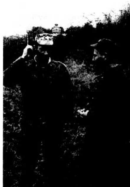
Сержант-семинарист о различии “духов” Стр.8