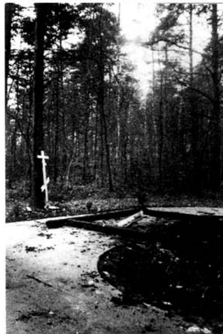
Пепелище на святом месте