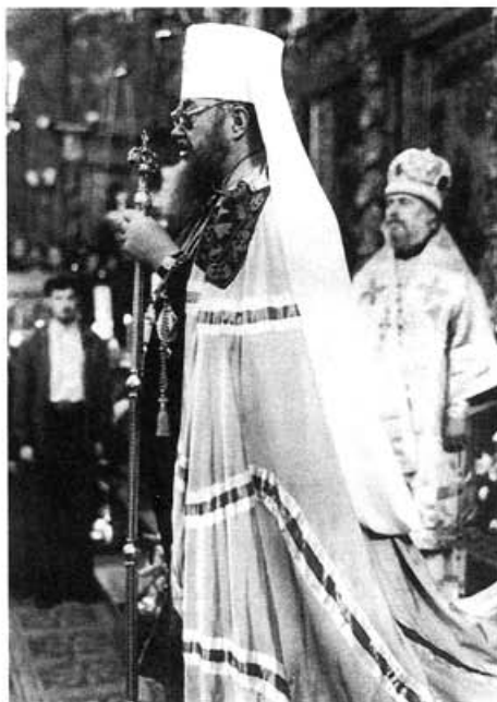
Блаженнейший Савва, Митрополит Варшавский и Всея Польши

В то время в Польше оставался всего один православный епископ, и были