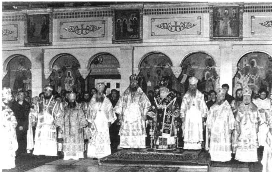
Святейший Максим, Патриарх Болгарский, возглавил Божественную литургию в престольный праздник Покровского храма Московской Духовной Академии