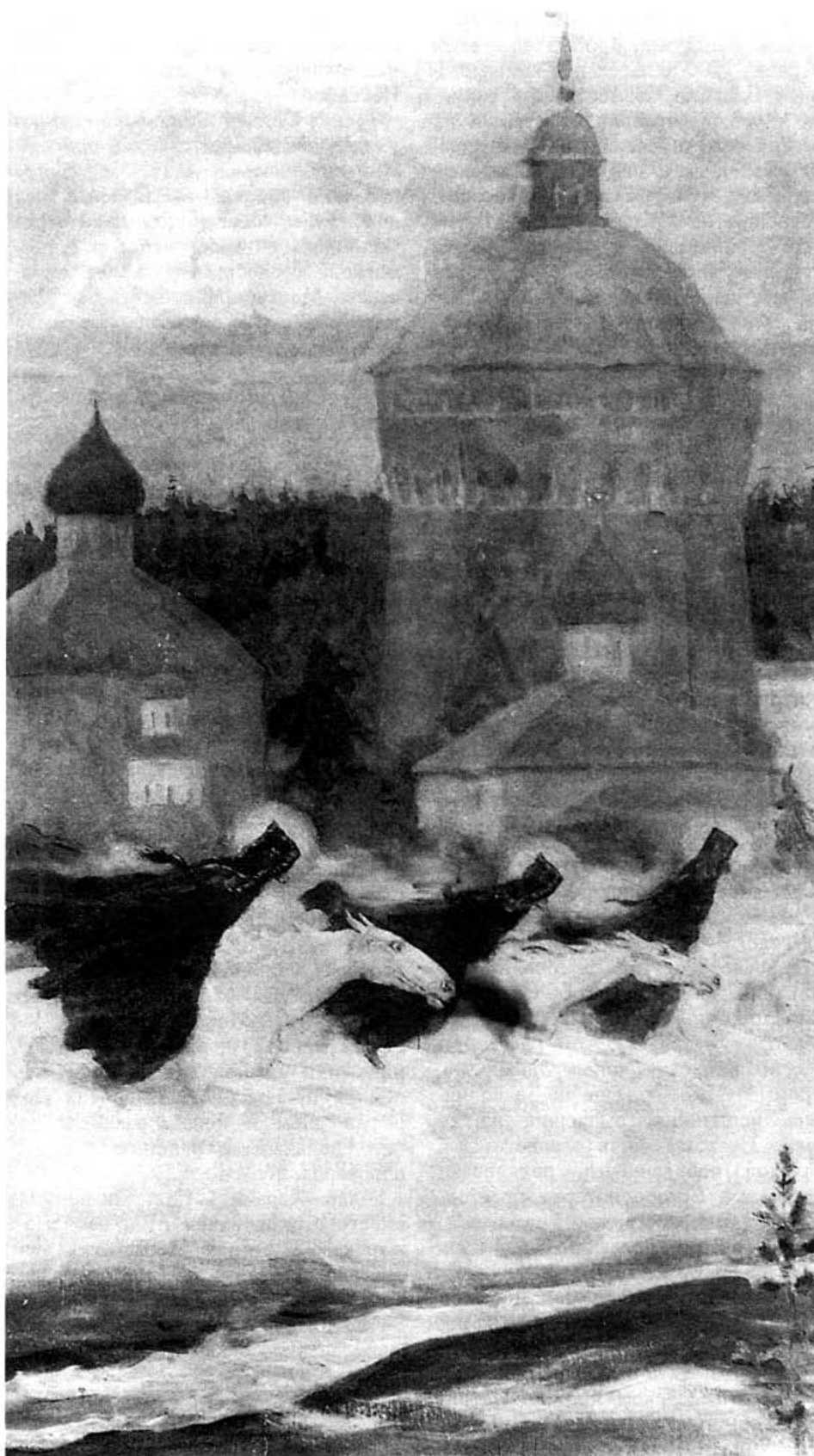
М.В. Несторов. Всадники (Эпизод осады Троице-Сергиевой Лавры). ЦАК МДА

города двигался к Москве князь Михаил Скопин-Шуйский с войском. В это время под стены Троице-Сергиева монастыря прибыл разбитый польский военачальник Зборовский со своим отрядом. Он поднял Сапегу на смех. «Пан же Зборовский, — повествует Авраамий Палицын, — ругаясь, понося Сапегу, Лисовского и всех панов, говорил: «Что стоит бездельное ваше стояние около лукошка? Что стоит лукошко то взять да ворон передавить?» 28 Сапега согласился на новый приступ. Этот приступ состоялся 31 июля 1609 года. В монастыре в это время оставалось здоровых не более двухсот человек. Однако это предприятие вновь окончилось для поляков полным провалом. Приступ был отбит с потерей убитой лишь одной женщины. Потери же со стороны штурмующих были большие, особенно в отряде Зборовского. Теперь пришел черед Сапеги и Лисовского смеяться над ним: «Чего ради не одолел ты лукошко? Постарайся еще, ты ведь такой храбрый, не посрами нас, пойдди, разори это лукошко, доставь вечную славу королевству польскому. Нам непривычны приступы, а ты — премудр, позаботься о себе и о нас». 29