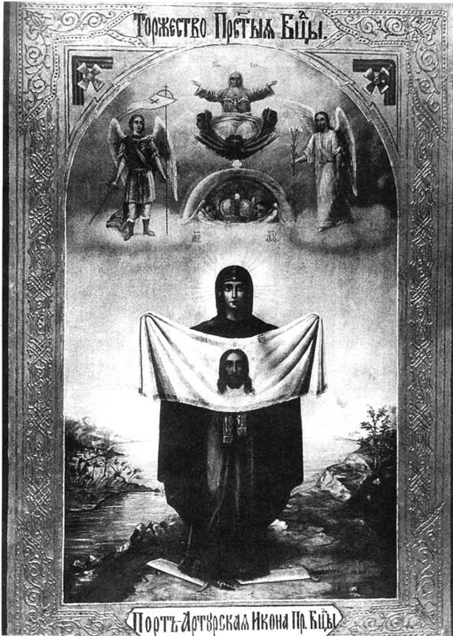
Порт-Артурская икона (Торжество Пресвятой Богородицы) нач. XX в. ЦАК МДА

можно, именно она и находится сейчас в академическом музее.