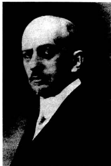
Православный меч Ивана Ильина Стр. 22

На 1-й стр. обложки: “Отслужу, как надо, и вернусь...”.