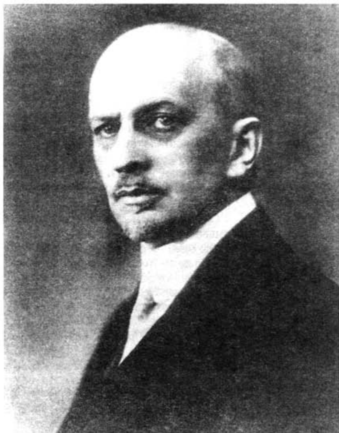
И. А. Ильин 1931 г.

Иван Ильин и Лев Толстой: так кто же христианин?